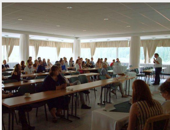
Obr. 4., 5. – Jarná internacionalizovaná škola doktorandov UPJŠ, Liptovský Ján