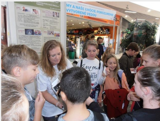
Obr. 1.: Katedra psychológie FF UPJŠ

Katedry histórie – Mesto ako ho nepoznáš , Katedry pedagogickej psychológie a psychológie zdravia – My a naše emócie, porozumenie vytvorené vedou , a Katedry slovakistiky, slovanských filológií a komunikácie – Nevedko v krajine masmédií .