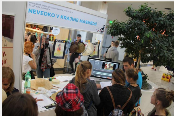
Obr. 2.: Katedra slovakistiky, slovanských filológií a komunikácie FF UPJŠ