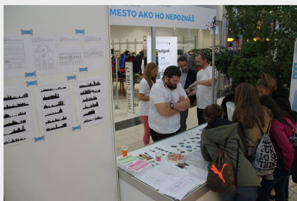
Obr. 3. : Katedra histórie FF UPJŠ

Výsledky svojej vedeckovýskumnej činnosti prezentovali doktorandi zo všetkých študijných programov realizovaných na fakulte na 5. ročníku Jarnej internacionalizovanej školy doktorandov UPJŠ (obr. 4. – 5.) konanej 11. – 16. 6. 2018 v Liptovskom Jáne. Tento rok sa konala vďaka podpore rozvojového projektu MŠVVaŠ SR „ Internacionalizácia, interdisciplinarita a inovácia vysokoškolského vzdelávania na Univerzite Pavla Jozefa Šafárika v Košiciach “ a vďaka podpore z interných zdrojov našej univerzity zúčastnilo tohto podujatia 50 doktorandov z celej univerzity a 13 zahraničných alebo domácich lektorov.