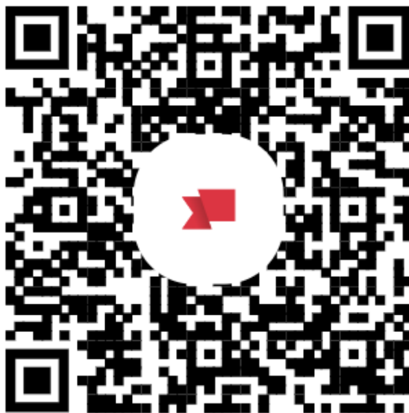
Obrázok 1 QR kód pre rezervačný systém CSVM

Bližší popis, ako aj samotná rezervácia služieb je možná prostredníctvom webovej stránky: https://centrum-simulatorovej-a-virtualnej-mediciny.reservio.com/ . Webovú stránku rezervačného systému je možné načítať aj pomocou QR kódu (Obrázok 1).