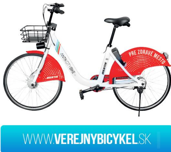
Obrázok 2 - Antik Bicykel

Zaradenie – bicykel má v sebe zabudovanú sim-kartu a s data centrom komunikuje prostredníctvom GSM siete v packetoch. Elektrické súčasti bicykla sú napájané batériou, ktorá je dobíjaná cez solárny panel umiestnený v košíku. Odomknutie zámku sa udeje uvoľnením relátka, ktoré drží samotný mechanizmus zámku, ktorý sa pomocou pružiny otvorí. K zamknutiu dochádza mechanicky, rukou zákazníka. Senzor je gyroskopický, ktorý nám dáva informáciu o neoprávnenom pohybe. Zistenie neautorizovaného pohybu je zabezpečené pomocou gyroskopu a logiky v systéme, ktorá ohlásí pohyb zariadenia bez odomknutia.